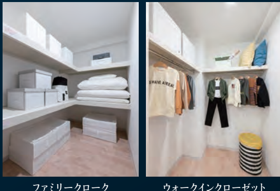
ファミリークロック